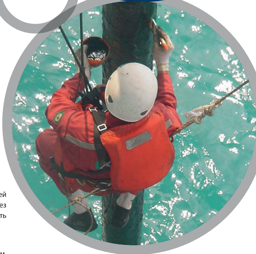
Ремонт морского стояка