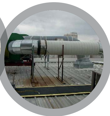
Газоотводы и вытяжные каналы